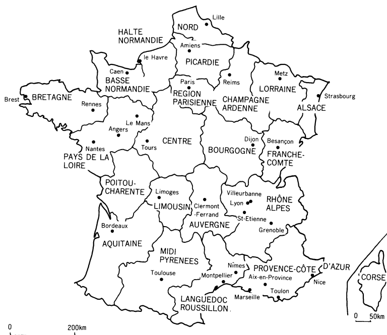
Carte 1. les 22 régions et les 30 plus grandes villes

Corse, la région du Limousin a la plus faible population, seulement 737,000 habitants, cela n'équivaut qu'à 1.4% de la population totale et 7.3% de celle de l'Ile-de-France.