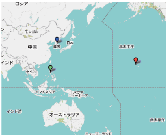
図5 キーワード「戦争」で検索した結果

キーワードを入力するか、年を入力し、地図のラジオボタンを選択して「表示」のボタンを押すと、図5のような画面が表示される。