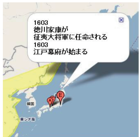
図8 図6でEのアイコンをクリックした場合