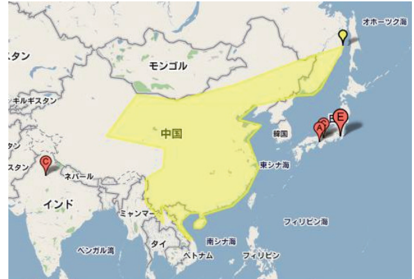
図6 1603年で検索した地図表示の結果

地図上にあるアイコンをクリックすると、史実の説明部分が表示されるようになっている。表示される内容は、発生年と内容である。また、同じ場所で発生した史実は1つのアイコンで表示され、そのアイコンをクリックした場合はそれらがまとめて表示されるようにしている（図8）。