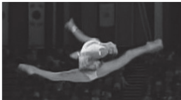
写真8 新体操のジャンプ (文献17より転載)

技中のジャンプを示している。膝の曲げ伸ばしや、胴の後屈の程度に違いはあるが、この写真から、「簡潔性」の価値観の違いはほとんど見られない。