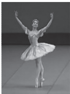
写真5 クラシック・バレエのポーズ (文献19より転載)

このフォキンの主張の意味するところは、既成の運動形式にとらわれない動きによって演技の主題を表現するのが、モダン・ダンスの特性ということである。特に1) は、新しい動きを創造する