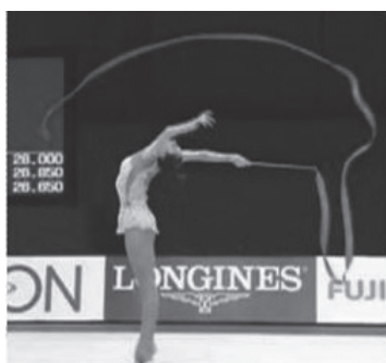
写真6 新体操のポーズ (文献20より転載)