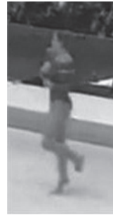
写真9 体操競技のターン (文献22より転載)

なぜ、このように動きが異なるのか。これは、重視する技の違いであると考えられる。体操競技は、宙返りなどのアクロバット系の技を重視するため、ターンの難しさは今のところ、主に開脚や回