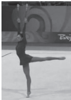
写真2 新体操のアラベスク (文献15より転載)

上であり、この場合は、さらに胸を後屈させている。それぞれが伸びていくというより、可能な限り開脚し、胸を後屈させているという印象を受ける。現在の新体操では、このようなジャンプは価値の高いものであるとされているが、クラシック・バレエにはこのような動きは存在しない。なぜなら、背、頭、手によって伸びていく「延長性」が崩れてしまうからである。