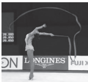
写真12 新体操におけるポーズ (文献20より転載)