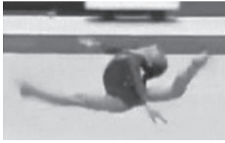
写真7 体操競技のジャンプ (文献22より転載)