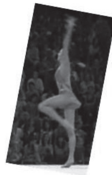
写真10 新体操のピボット (文献17より転載)

転数に求めている 24) 。新体操では、写真2、写真4、写真8のようなジャンプ・バランス・ピボットなどを重視し、ピボットにおいては、開脚や胴の後屈など、身体の柔軟性や回転数、姿勢の変化に、身体運動の難しさを求めている。このことから、新体操におけるピボットは、大きな得点源であるため、ピボットへの関心が高く、ピボットの技術開発が、体操競技よりも進んでいるということが考えられる。したがって、現段階では、ターンにおける「延長性」のある体線が体操競技にはほとんど見られないが、今後、体操競技のダンス系の技が豊富になり、「延長性」がみられるターンが行われる可能性もあると考えられる。