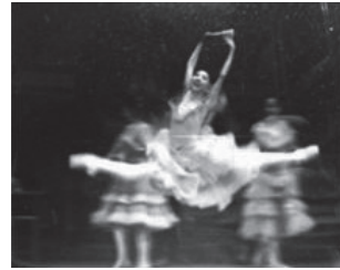
写真3 クラシック・バレエのジャンプ (文献16より転載)

それは評価項目の違いからも明らかである。クラシック・バレエでは、「螺旋」の動作感覚による身体運動が重視され、ここに、非日常性を求めているといえる 13) 。それに対して、新体操では、主に身体運動や手具操作の技の難しさやできれば先に評価の力点が置かれ、柔軟性を必要とする姿勢