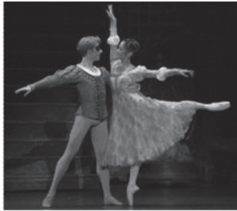
写真1 クラシック・バレエのアラベスク (文献14より転載)