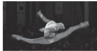
写真4 新体操のジャンプ (文献17より転載)

保持や姿勢変化、回転数の多さによる難しさにも非日常性を求める 3) 8) 9) 。しかし、開脚度が大きいほどよい、胸が大きく後屈しているほどよいというわけではない。なぜなら、それらの動きの中から、「延長性」の要素が全く欠落しては、動きの善さが色あせてしまうからである。したがって、新体操におけるの価値の要因には、クラシック・バレエにおける「延長性」とは異なる、最大開脚・最大後屈・最大跳躍・最大回転への指向性を加えた「延長性」が存在するといえる。