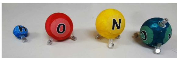
図2. 作成した原子モデル

制作した原子モデルを図2に示す。モデルの構造は、発泡スチロール球にビニル管を価数に合わせた本数だけ腕状に差し込み、外端に小型強力磁石を詰めてある。磁石の引き合わせで共有結合を表現し、原子ごとにサイズ・色を設定した。