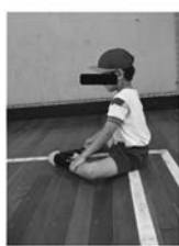
写真1 基礎課題のあぐら座位での前後左右の重心移動