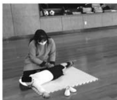
写真4 基礎課題の側臥位での軀幹ひねり動作