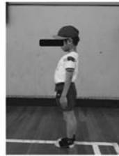
写真3 基礎課題の立位での前後左右の重心移動