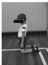
写真2 基礎課題の膝立ち位での前後左右の重心移動