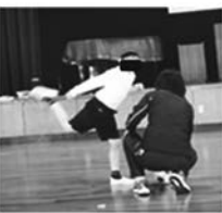
写真5 応用課題の様子